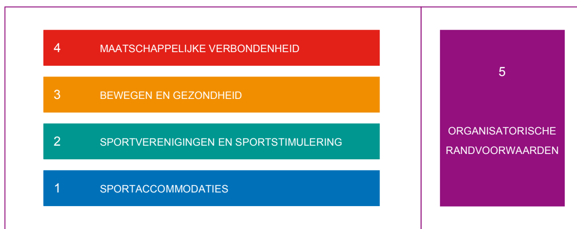
Figuur 1. Bouwstenen van het sport- en beweegmodel De Ronde Venen.